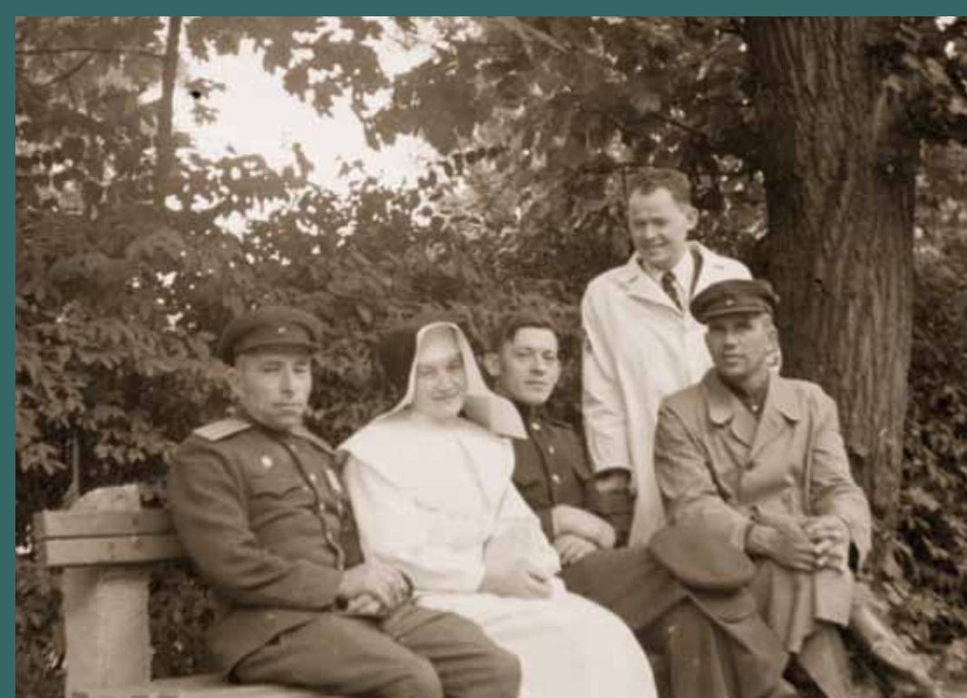
Terezín 1945. Muži a ženy ze zdravotnického personálu vědomě riskovali své životy. Lékaři a řádové sestry