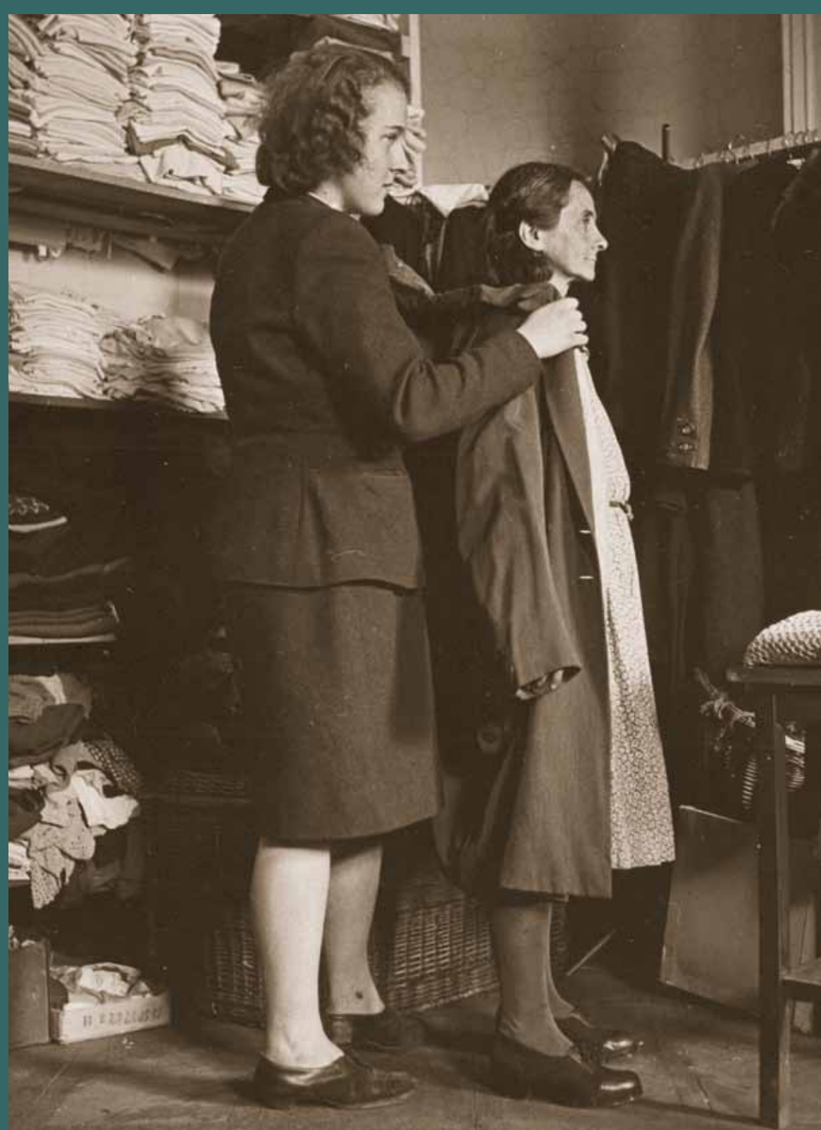
Oblečení pro navrátilce.