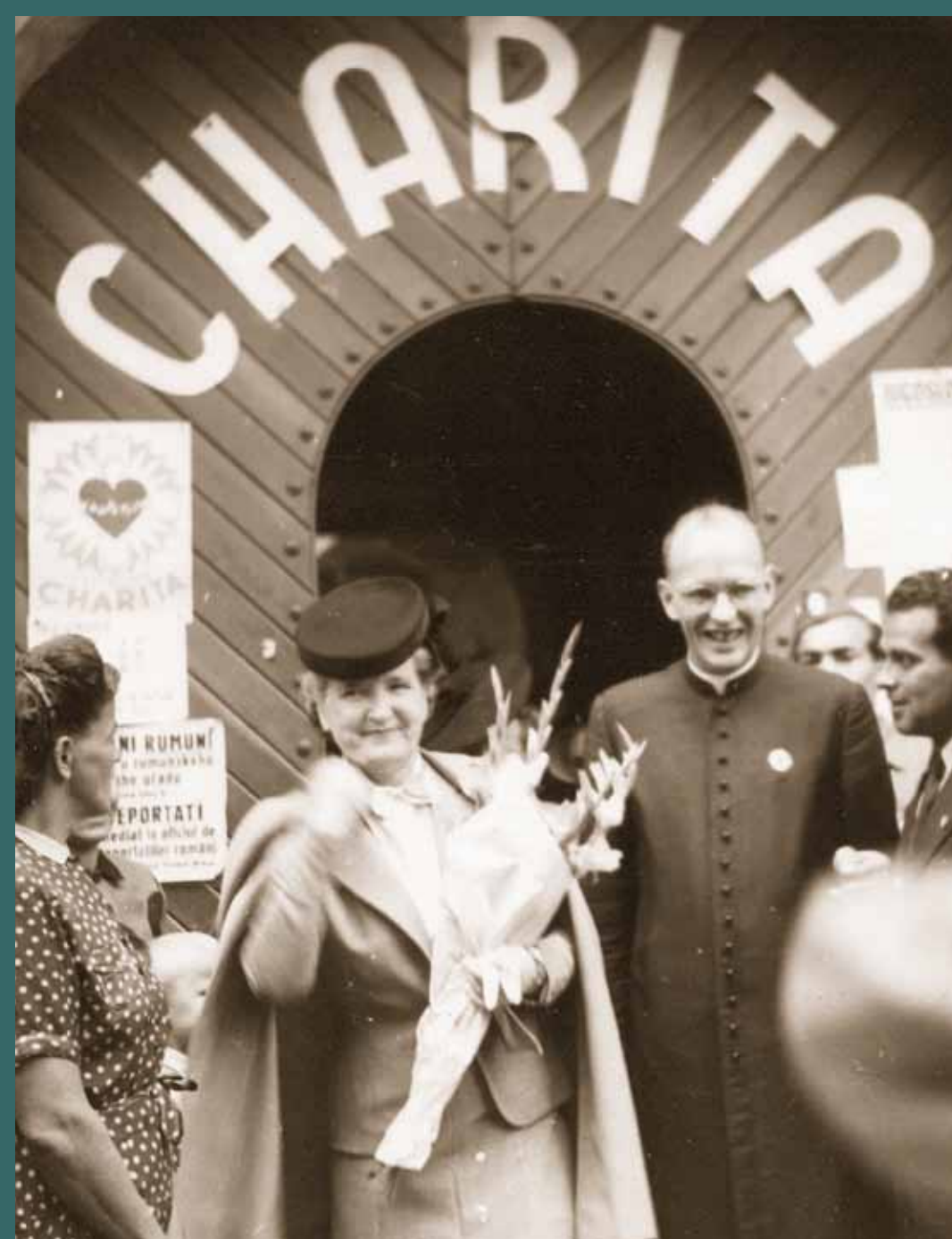
Manželka prezidenta republiky paní Hana Benešová navštívila 12. července 1945 malostranské ústředí Charity a s uznáním se vyslovila o práci s repatrianty.